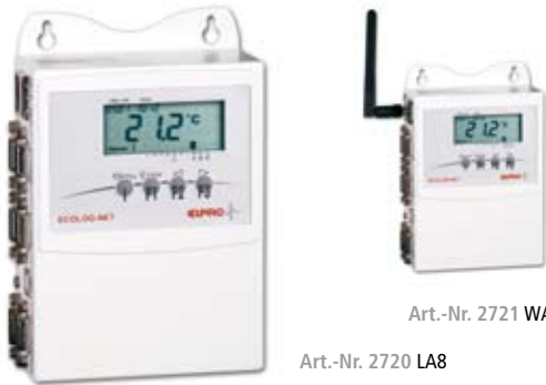
Art.-Nr. 2720 LA8