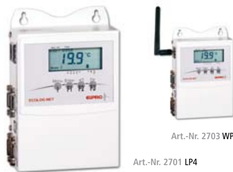
Art.-Nr. 2701 LP4