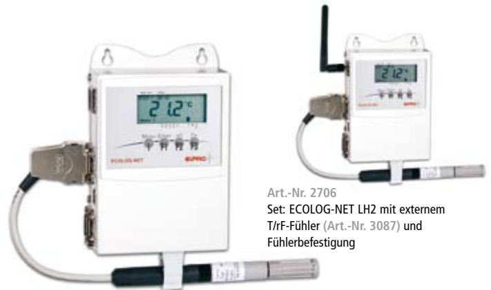
Art.-Nr. 2706 Set: ECOLOG-NET LH2 mit externem T/RH-Fühler (Art.-Nr. 3087) und Fühlerbefestigung Art.-Nr. 2705 LH2 Art.-Nr. 2707 WH2 (wireless LAN)