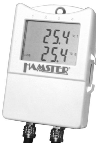
Datenlogger HAMSTER-E ET2; Art.-Nr. 4902