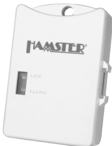
Datenlogger HAMSTER-E ET1; Art.-Nr. 4901