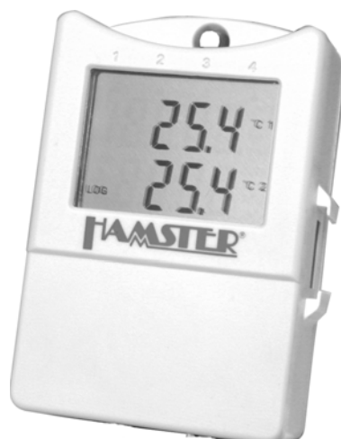
Datenlogger HAMSTER-E ET1-D; Art.-Nr. 4904