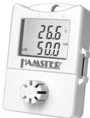
Datenlogger HAMSTER-E EHT1; Art.-Nr. 4903